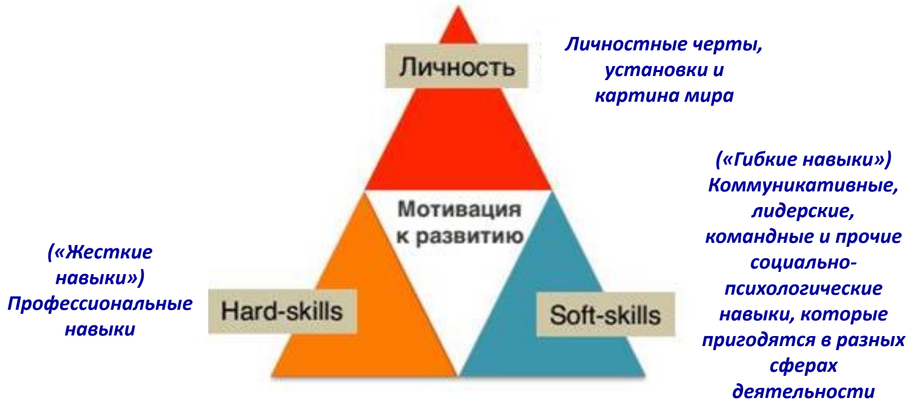
Рис. 1. Треугольник личностного и профессионального развития

Волонтерская деятельность позволяет развиваться студентам Педагогического института как личностям благодаря созданию непрерывного образовательного пространства и благоприятной социально- педагогической среды на основе полисубъектного взаимодействия студентов