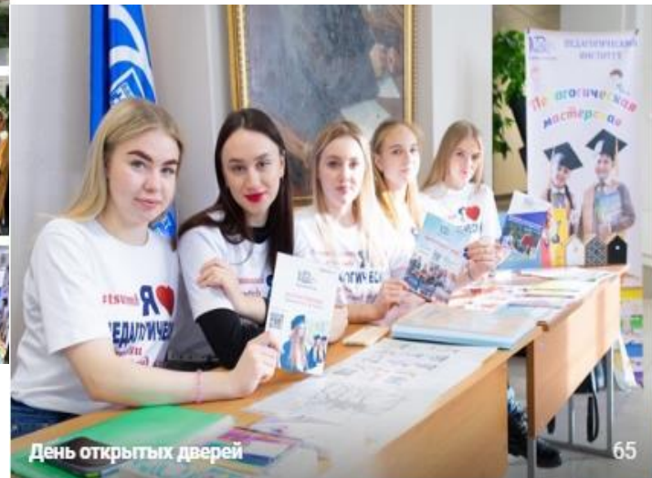
День открытых дверей