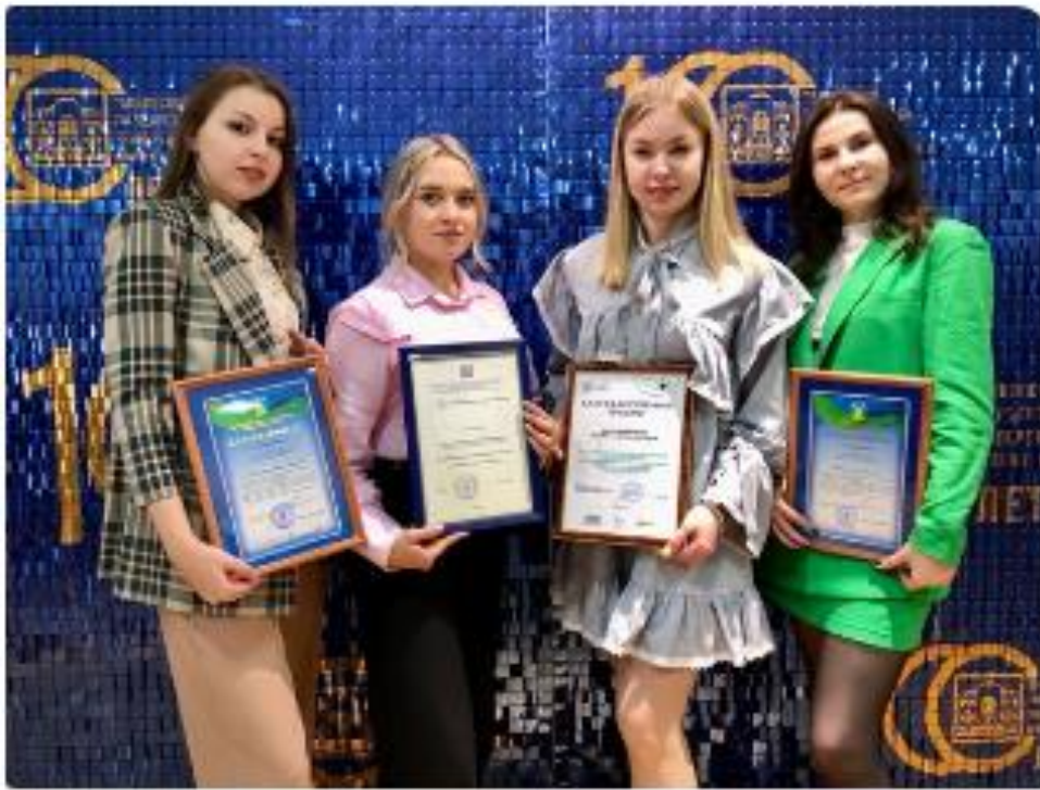
Премия «Державинский волонтер»